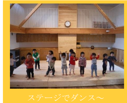
ステージでダンス〜