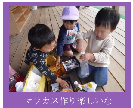
マラカス作り楽しいな