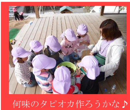
何味のタピオカ作ろうかな♪