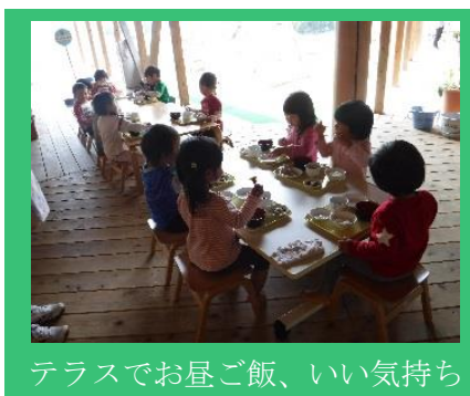
テラスでお昼ご飯、いい気持ち