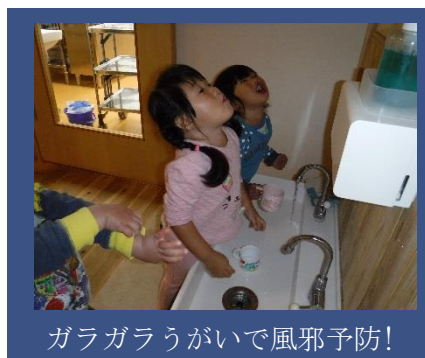
ガラガラうがいで風邪予防!