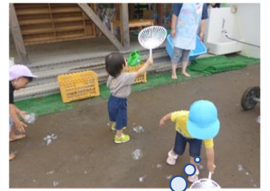
しゃぼん玉、とんでいけ～