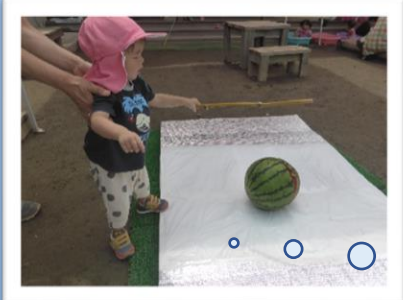
すいか、割れるかな?