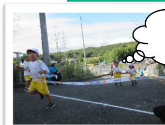
坂道ダッシュ よいーどん。