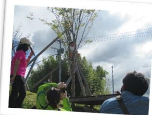
ふじ組さん 頑張りました