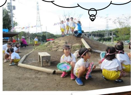
これから、げんきな森フェスを始めます。