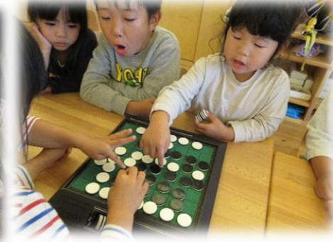
ひっくりかえしたよー！