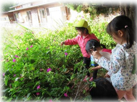
おしろい花み一つけた！