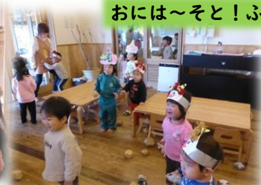
糊を使って鬼のお面づくり