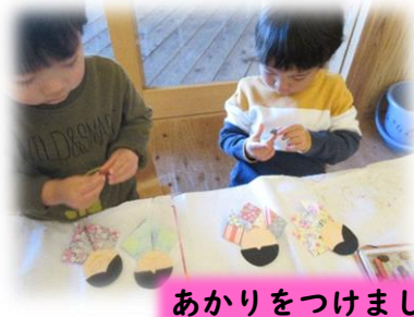
あかりをつけましょうぼんぼりに～♪