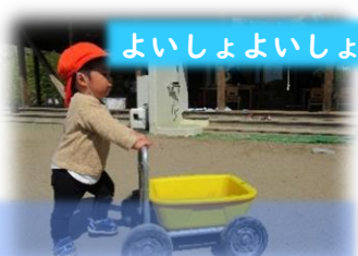
よいしょよいしょ