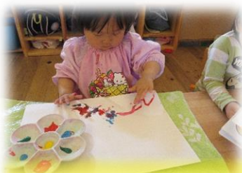
絵の具がムニムニムにするね

わらべうたの絵本をお昼寝前に読むのを楽しみにしています。「あがりめさがりめ」や「げんこつやまのたぬきさん」などいろいろなわらべうたを歌っていますが、特にお気に入り「だるまさん」！「あっぷっぷ〜」の所でみんな上手に頬を膨らませて、その後はにこにこ笑顔。絵本を読んでいない時にも「あっぷっぷ〜」と楽しんでいますよ。