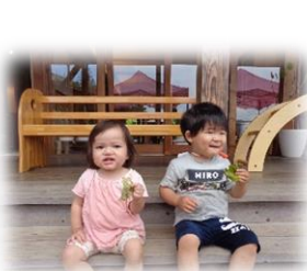
水たまりでじゃぶじゃぶしたよ