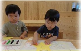
お絵描きぐるぐる

ももやメロンなど美味しそうな果物が出てきます。「なにかな? なにかな?」と言うと「ももー!」「ぶどう!」と言ってくれたり、興味津々に指さしたりして反応してくれますよ。「今日、メロンが給食にでてきたね」などとやり取りを楽しみながら絵本の時間を過ごしましたよ。