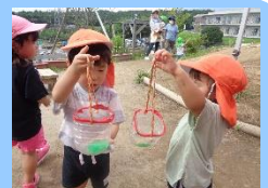
かき氷食べたり、氷を触って遊んだね