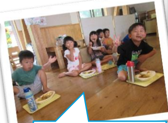
みんなと食べると おいし～いね。