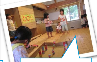
いろんなゲームを したよ。