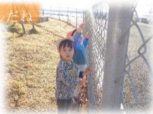
お外でもいっぱい遊んだよ