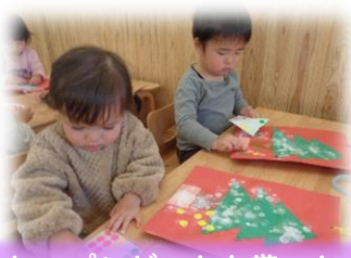
サンタさんに会えて嬉しかったね、プレゼントも貰ったよ