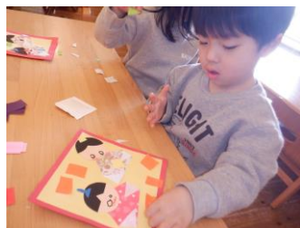
お顔も上手に描けたね はさみで切ったのりで貼ったよ