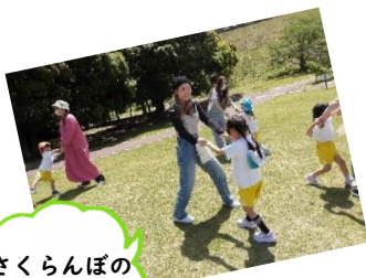
さくらんぼのマンボ