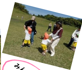
みんなで遊べて嬉しいね。

バス遠足はとても楽しかったですね。「バス遠足はあと何回寝たらあるんでー。」「私はハムスター号やった。」「お弁当一緒に食べようね。」とお友だちと話したりワクワクする姿がたくさんありましたよ。当日はみんなでふれあい遊び等を喜んでしたりお友だちやお友だちのおうちの方とも楽しみながら遊んでいる姿がみられてうれしかったです。たくさんのご参加ありがとうございました。