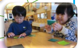
みんな無言で集中しています。