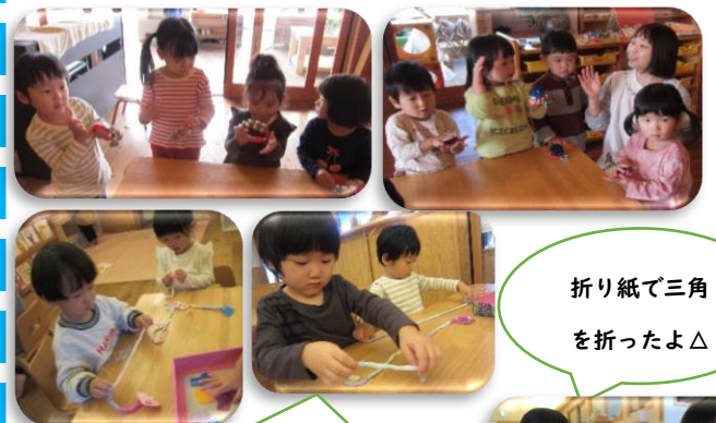
折り紙で三角を折ったよ△

また、すずやカスタネットを使って楽器あそびもしています。「みんなの楽しい音がサンタさんに届け〜」と歌いながら鳴らしています。